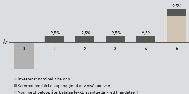
Illustration - Kreditcertifikat High Yield Europa Månadsvis nr 5357

Utbetalning av kupongerna sker månadsvis från och med den 4 juli 2025 fram till och med 4 juli 2030. Utbetalning baseras på antalet dagar i förhållande till ett helt år som har passerats under innevarande år. Första årets sammanlagda kupong kan därför vara lägre eller högre beroende på om perioden är kortare eller längre än ett år. Denna förenklade illustration visar den indikativa kupongen om 9,5% per år.