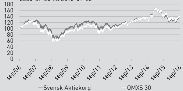
Historisk kursutveckling* 2006-09-26 till 2016-09-26

Diagrammet visar den historiska utvecklingen för aktiekorgen och ett svenskt aktieindex (OMXS30) sedan 2006-09-26 och är indexerat till 100 från detta datum. Historisk utveckling innebär ingen garanti för framtida avkastning.