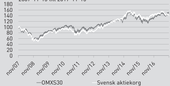
Historisk kursutveckling* 2007-11-15 till 2017-11-15